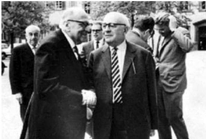
Max Horkheimer (izquierda) y Theodor Adorno (derecha)

El Dr. Timothy Leary nos facilitó otra visión de lo que había en la