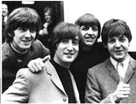
Theodor Adorno y los Beatles

de los mundos » (11), una adaptación de la famosa novela de H. G. Wells producida por Orson Wells . « El estudio de la actitud de la población hacia el programa de radio hizo posible discernir muchas